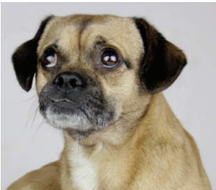
Dieser Mops kann atmen ...